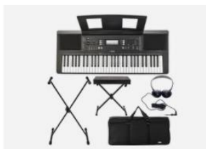
Yamaha PSR-E373 Deluxe Bundle